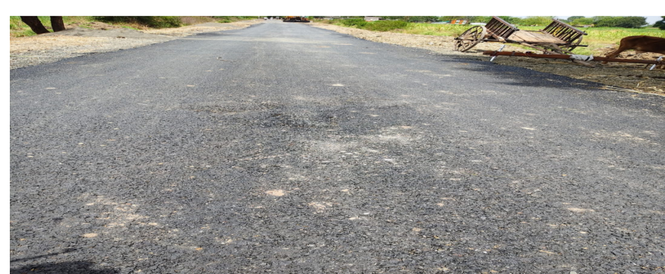
दिवसेंदिवस खालावत चालली आहे. त्यामुळे अपघातांचा धोका वाढला असून नागरिकांचे हाल होत आहेत. प्रशासनाच्या निष्क्रियतेमुळे संताप अधिकच तीव्र झाला आहे. ग्रामस्थांनी या प्रकरणी

खडे पडल्याने या कामाच्या गुणवत्तेवर मोठा प्रश्नचिन्ह निर्माण झाला आहे. हा प्रकार केवळ निष्काळजीपणा नसून शासनाच्या निधीची उघड लूट असल्याचा आरोप नागरिकांनी केला आहे. या प्रकरणात संबंधित अभियंते आणि अधिकाऱ्यांची भूमिका देखील संशयाच्या भोवऱ्यात सापडली आहे. गुणवत्ता नियंत्रणाच्या सर्व नियमांना जाणीवपूर्वक पायदळी तुडवत देकेदाराला मोकळीक दिली जात असल्याचा गंभीर आरोप ग्रामस्थांनी केला आहे. "अधिकाऱ्यांच्या संगनमताने शिवाय एवढ्या उघडपणे निकृष्ट काम होऊच शकत नाही," असा थेट आरोप करण्यात आला आहे. दरम्यान, हा रस्ता परिसरातील नागरिकांसाठी अत्यंत महत्त्वाचा असून शेतकरी, विद्यार्थी आणि दैनंदिन प्रवास करणारे नागरिक यावर अवलंबून आहेत. मात्र, निकृष्ट कामामुळे रस्त्याची अवरुध्द