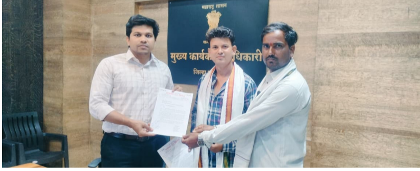
काम अर्धवट सोडून ग्रामस्थांना पाण्यापासून वंचित ठेवण्यात आले, असा आरोप करण्यात आला आहे. दरम्यान, या गंभीर प्रश्नाकडे प्रशासनाचे लक्ष

तांड्यातील नागरिकांनी दिलेल्या माहितीनुसार, या योजनेअंतर्गत पाणीपुरवठ्याची कामे अपूर्ण व निकृष्ट दर्जाची करण्यात आली आहेत. परिणामी, आजही राठोड तांड्यातील नागरिकांना भीषण पाणीटंचाईला सामोरे जावे लागत असून, पिण्याच्या पाण्यासाठी कोसो दूर भटकती करावी लागत आहे. यापुढील राष्ट्रीय पेयजल योजना अंतर्गत २९ लाख रुपयांचा निधी मंजूर झाला होता. मात्र त्या वेळीही