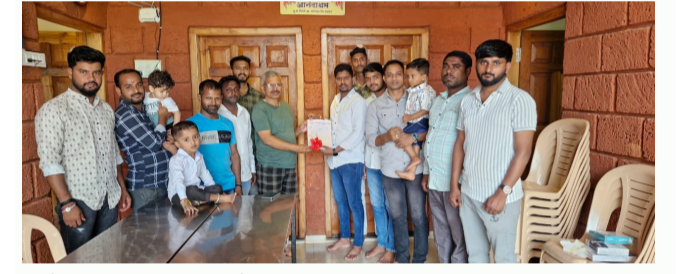
माँ साहेब युथ फाउंडेशनचा गणेश उत्सव मध्ये र्वर्चाला आळा घालून मायेचा उपक्रम केला