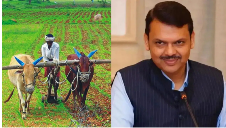
ठेवा आहे. मुख्यमंत्री आणि कृषीमंत्री दिलगिरी व्यक्त करतो. संकटग्रस्त शेतकऱ्यांना कर्जमाफी देण्यासंदर्भात

स्मृतिदिनी यवतमाळच्या पुसद येथे एका पुरस्कार सोहळ्याचे आयोजन करण्यात आले होते. राज्यातील 13 शेतकऱ्यांना वसंतराव नाईक कृषि प्रतिष्ठानच्या वतीने कृषी गौरव पुरस्कार देण्यात आला. या कार्यक्रमाला मृदा व जलसंधारण मंत्री संजय राठोड हे उपस्थित होते. यावेळी त्यांनी शेतकऱ्यांच्या कर्जमाफीबाबत मोठे विधान केले आहे संजय राठोड यांचे मोठे विधान मंत्री संजय राठोड यांनी कृषी गौरव पुरस्कार प्राप्त शेतकऱ्यांचे अभिमानंदन केले. ते म्हणाले, हा पुरस्कार नसून नव्या पिढीला दिलेला