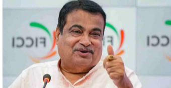
त्यांनी आता नागपुरात बोलताना मोठे विधान केले आहे. त्यांच्या या विधानाचे अनेक अर्थ काढले जातात. माझ्या अनुभवातून लक्षात आलंय की सरकार निकम्मी असते, असं ते भाषणात म्हणाले