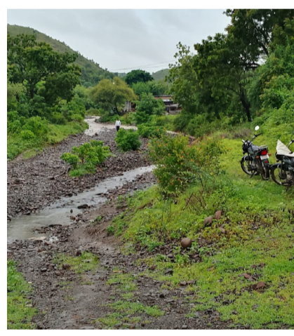
बीड प्रतिनिधी, बीड तालुक्यातील