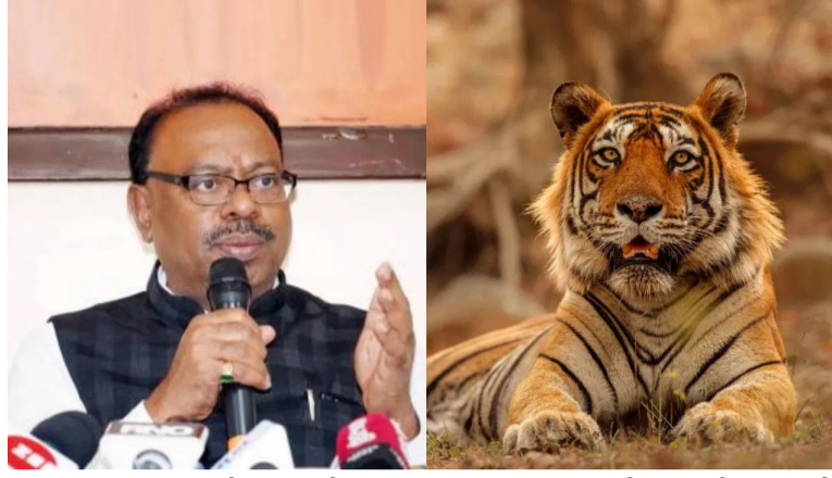
या तंत्रज्ञानामुळे लोकांचा जीव वाचणार - बावनकुळे बोलताना बावनकुळे म्हणाले की, 'गेल्या काही वर्षांमध्ये वाघांचे प्रमाण वाढलं आहे. त्यामुळे गावाकडे वाघ येत आहेत. गेल्या काही काळात वाघाने अचानक हल्ला केल्याने काही लोकांचा जीव गेलेला आहे. ही टेक्नॉलॉजी लोकांचा जीव वाचवण्याकरिता आहे. हे तंत्रज्ञान जंगलात वापरले गेले तर मोठ्या प्रमाणात जीवहानी कमी होईल.' शेतकऱ्यांना आर्थिक मदत देणार चंद्रशेखर बावनकुळे यांनी पुढे बोलताना सांगितले की, 'जंगलाला लागून असलेली शेतकऱ्यांची जमीन वन्य प्राण्यांमुळे पडीक पडलेली आहे. अशा शेतकऱ्यांना सरकार दरवर्षी ५० हजार रुपये एकरी तीस वर्षांसाठी भाडे देणार आहे. या जमिनीवर वनविभाग सोलार प्रकल्प, बांबू लागवडीचे प्रकल्प, ग्रासलॅंड डेव्हलप करणार आहे.'

जंगलात ९०० कॅमेरे लावणार - बावनकुळे याबाबत बोलताना महसूलमंत्री चंद्रशेखर बावनकुळे यांनी म्हटले की, आपण जगातील आधुनिक घेत आहोत. आता ९०० ठिकाणी कॅमेरे लावले जाणार आहेत. तसेच ९०० ठिकाणी अलार्म असतील, ताडोबापासून ते नवेगाव बांध पर्यंत सर्वच फॉरेस्ट एरियात हे कॅमेरे असणार आहेत. जेव्हा एखादा वाघ किंवा बिबट्या गावाकडे किंवा खाजगी जाता दिसले तेव्हा हे कॅमेरे त्यांना डिटेक्ट करतील आणि ताकाळ गावातील अलार्म वाजेला.