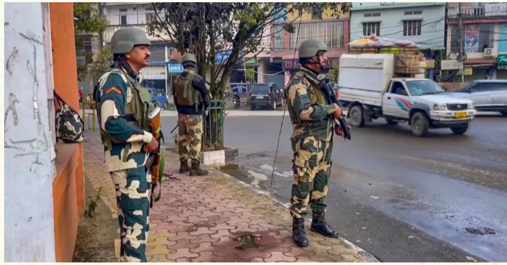
म्हणाले की या घटनांमुळे कोणतीही पूर्वसूचना न देता आपत्कालीन परिस्थितीत इंटरनेट सेवा बंद करण्याचा निर्णय घेतला गेला. त्यामुळे असामाजिक तत्त्वे त्यांचा अजेंडा राबवू शकणार नाहीत. तर नियमांचे

अनेक ठिकाणी तीव्र प्रदर्शन केले. काही ठिकाणी जमाव हिंसक झाला. असामाजिक तत्वांचा मोठा डाव अरामबाई यांच्या अटकेच्या आडून काही असामाजिक तत्त्वे समाज माध्यमांचा वापर करून समाजात तेढ निर्माण करण्याचा प्रयत्न करत आहेत. राज्यातील कायदा आणि सुव्यवस्था बिघडवण्यासाठी प्रक्षोभक संदेश, चित्रे आणि व्हिडिओ प्रसारित करण्यात येत आहे. त्यामुळे शांतता प्रक्रियेला गालबोट लागण्याची शक्यता आहे. गृह विभागाचे सचिव एन. अशोक