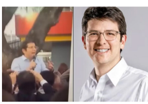
शहरात झाली होती. 1991 मध्ये ड्रग माफियाने त्यांचे बोगोटामधून अपहरण केले होते. त्या सातत्याने ड्रग तस्करी आणि संघटित गुन्ह्यांविरुद्ध लिहित होत्या. वाचा: अपने अम्मी-अबू की कुर्बानी दो...; पाकिस्तानी क्रिकेटपटूने ईदला

डोक्यात लागल्याचे सांगितले जात आहे. त्याची प्रकृती चिंताजनक आहे. आईचीही 34 वर्षांपूर्वी झाली होती हत्या मिगुएल उरीबे यांच्या राजकीय कारकिर्दीची सुरुवात बोगोटा कॉन्सिलचे सदस्य म्हणून झाली होती. ते अवघे 39 वर्षांचे आहेत. ते कोलंबियाचे माजी राष्ट्रपती जूलियो सेझर टर्बे यांचे नातू आहेत, जे 1978 ते 1982 पर्यंत कोलंबियाचे 25 वे राष्ट्रपती होते. त्यांची आई डायना टर्बे एक पत्रकार होत्या. त्यांची हत्या 34 वर्षांपूर्वी बोगोटा