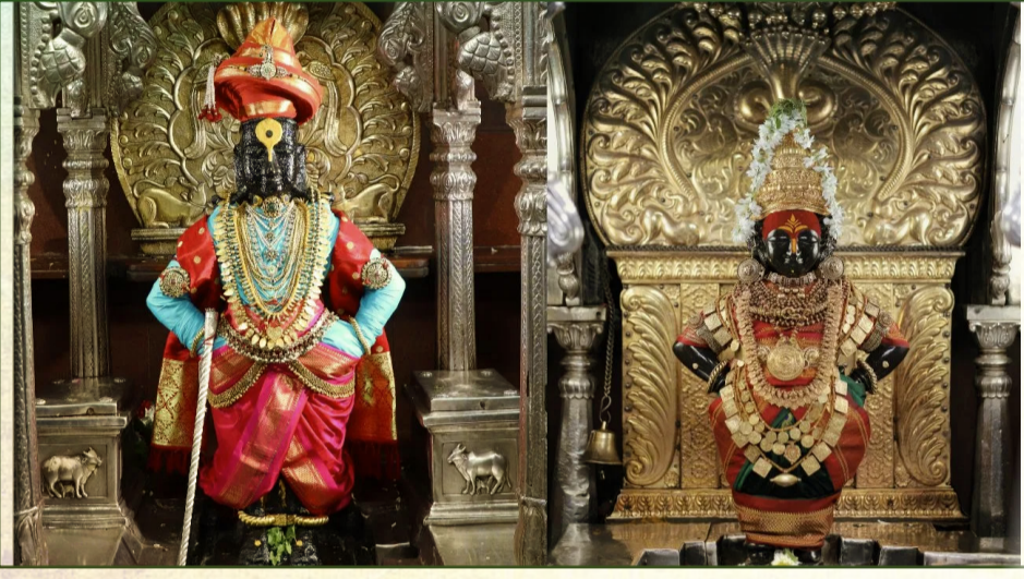
तिरुपती बालाजी मंदिराप्रमाणे दर्शनासाठी टोकन प्रणालीचा वापर पंढरपुरातील विठ्ठल मंदिरात करण्यात येणार आहे. इतिहासात पहिल्यांदाच टोकन दर्शन प्रणालीचा वापर विठ्ठल-रुक्मिणी मंदिरात करण्यात येणार आहे. श्री विठ्ठल, रुक्मिणी मातेच्या टोकन दर्शन प्रणालीची चाचणी आजपासून सुरु करण्यात

आली. या टोकन दर्शन प्रणालीचे संगणकीय काम टीसीएस ही कंपनी करणार आहे. टोकन दर्शनाच्या माध्यमातून दिवसभरातून बाराशे भाविकांची दर्शन व्यवस्था करण्यात आली आहे. भाविकांना घरी बसून ऑनलाईन प्रणालीच्या माध्यमातून दर्शनाचा स्लॉट बुक करता येणार आहे. तिरुपती बालाजी मंदिरात भाविकांना दर्शनासाठी टोकन दिले जातात. त्याच पद्धतीचा वापर पंढरपुरातील विठ्ठल रुक्मिणी मंदिरात करण्यात येणार आहे. टोकन घेतल्यावर दर्शन मंडपात दुसऱ्या मजल्यावर भाविकांची बसण्याची व्यवस्था केली आहे. ज्या ठिकाणी भाविकांसाठी बैठक व्यवस्था करण्यात आली त्या ठिकाणी सर्वच सोय उपलब्ध करून देण्यात आल्या आहेत. बैठक व्यवस्थिततेत भाविकांना बसण्यासाठी त्याचवेळी शौचालय, स्नान गृह, भाविकांना चहा, नाश्ता तसेच विठ्ठलाचे ऑनलाईन दर्शन देखील पाहता येणार आहे.