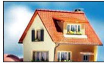
योजना,बिरसा मुंडा कृषि क्रांती योजना, डॉ.बाबासाहेब कृषि स्वावलंबन

योजना- प्रति थंब अधिक पिक योजनेतर्गत ठिबक/ तुषार घटकासाठी महाडीबीटी पोर्टलवर अनु.जाती व अनु.जमाती प्रवर्गातील शेतकऱ्याकरिता १० टक्के पर्यंत अनुदान उपलब्ध आहे. या संधीचा मोठ्या प्रमाणात लाभ घ्यावा.अनुदानाची मर्यादा खालील प्रमाणे आहे.शेतकरी वर्गावारी, राष्ट्रीय कृषी विकास योजना- प्रति थंब,अधिक पिक योजना, मुख्यमंत्री शाश्वत सिंचन