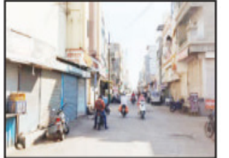
पवनचक्रीच्या वादातून अपहरण करून निर्दयपणे मारहाण करून निर्घृणपणे हत्या करण्यात आली