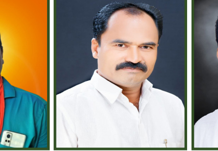
आज २८ १२ २०२४ रोजी ११ वाजता बीड येथे जिल्हाधिकारी कार्यालयवर निघणा-या निषेध मूक मोर्चात मोठ्या संख्येने सहभागी व्हावे असे आवाहन