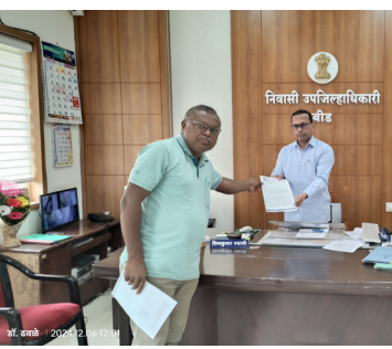
आदेशाने होर्डिंग काढण्यात आली.परंतु आज दि.०६ .१२.२०२४ वार शुक्रवार रोजी छत्रपती शिवाजी महाराज चौकात मुख्यमंत्री मा.देवेंद्रजी फडणवीस यांच्या मुख्यमंत्री पदी