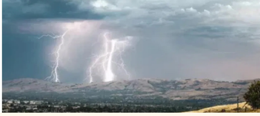
जिल्ह्यांमध्ये हलक्या पावसाची शक्यता आहे. पडला. गेल्या तीन-चार दिवसात सहा ते सात डिग्री तापमान वाढले. वा-याची दिशा