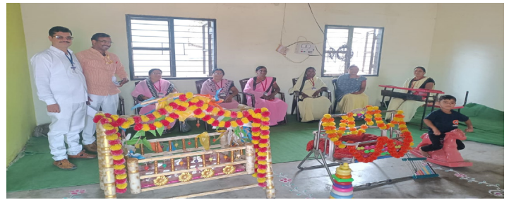
233-परळी विधानसभा मतदारसंघ पोहनेर: मतदारांच्या लहान बाळांची व्यवस्था करण्यासाठी पाळणाघराची सुंदर उभारणी