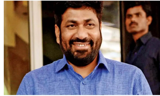
वेळची निवडणूक फार वेगळी आहे. कारण निवडणुकीच्या निकालानंतर राज्यात सरकार

महाराष्ट्र विधानसभा निवडणुकीच्या मतदानानंतर समोर झालेल्या एक्झिट पोलनुसार, महाराष्ट्रात महाविकास आघाडी आणि महायुती यांच्यात सत्ता स्थापनेसाठी काँटे की टक्कर बघायला मिळण्याची शक्यता आहे. त्यामुळे या निवडणुकीत छोटे पक्ष आणि अपक्ष हे या निवडणुकीत किंगमेकर ठरण्याची शक्यता आहे. याच पार्श्वभूमीवर महाविकास आघाडीच्या नेत्यांकडून अपक्ष आणि बंडखोर उमेदवारांसोबत बोलणी सुरु झाल्याची चर्चा सत्रांकडून मिळत आहे. विशेष म्हणजे या