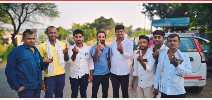
लोकशाही बळकट करण्यासाठी विधानसभा निवडणूक मतदान हक्क बजावताना युवक

सोने चांदीचे दागिने जप्त केले. एकूण 19 कोटी 50 लाख 56 हजार 937 रुपयांची बेकायदा मालमत्ता जप्त करण्यात आली. राज्यात ७०६ कोटी ९८ लाख रुपयांची मालमत्ता जप्त महाराष्ट्रातील विधानसभा निवडणुकीमुळे १५ ऑक्टोबरपासून पोलीस आणि निवडणूक आयोगाच्या पथकाकडून ठिकठिकाणी तपासणी केली जात आहे. राज्यात १५ ऑक्टोबर ते २० नोव्हेंबर २०२४ दरम्यान मोठ्या प्रमाणावर रोकड, सोने, चांदी, मद्य आणि अंमलपदार्थांचा साठा मिळून आला. विविध अंमलबजावणी यंत्रणांनी १५ ऑक्टोबरपासून बेकायदा पैसे, दारू, अमली पदार्थ, मौल्यवान धातू आदींच्या विरोधात केलेल्या कारवाईत एकूण ७०६ कोटी ९८ लाख रुपयांची मालमत्ता जप्त केली आहे.