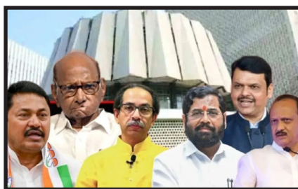
विधानसभा निवडणुकीला निकाल हा येत्या २३ तारखेला जाहीर होणार आहे. निकाल जाहीर झाल्यानंतर पुढच्या ४८

तासांची मुदत असणार आहे. यामध्ये सत्तेच्या ताब्या अपक्षांच्या हाती गेल्या तर महाराष्ट्राच्या राजकारणात पुन्हा एकदा ऑफिस पॉलिटिक्स रंगण्याची शक्यता सर्वाधिक आहे. २६ नोव्हेंबरच्या रात्री १२ वाजेच्या आत सरकार स्थापनेचा सोपस्कार पार पडला नाही तर २६ नोव्हेंबरच्या मध्यरात्रीपासून महाराष्ट्रात पुन्हा एकदा राष्ट्रपती राजवट लागू होण्याची दाट शक्यता आहे. महाराष्ट्र