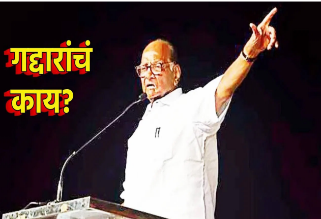
महाराष्ट्र विधानसभा निवडणुकीपूर्वी राज्यात मोठ्या

घडामोडी घडल्या. 2019 पासूनच राज्याच्या राजकारणाने वेगळ्या वाटेवर प्रवास सुरू केला. जिवलग मित्र एकमेकांचे शत्रू झाले. तर दोन-अडीच वर्षांपूर्वी राज्यातील दोन मोठ्या पक्षांना फुटीचा फटका बसला. शिवसेना दुभंगली. तर अजित पवार समर्थकांसह महायुतीच्या खेम्यात दाखल झाले. राष्ट्रवादीत उभी फूट पडली. राजकारणात गद्दार हा परवलीचा शब्द झाला. या गद्दारांचं करायचं काय असा सवाल भरसभेत शरद पवार