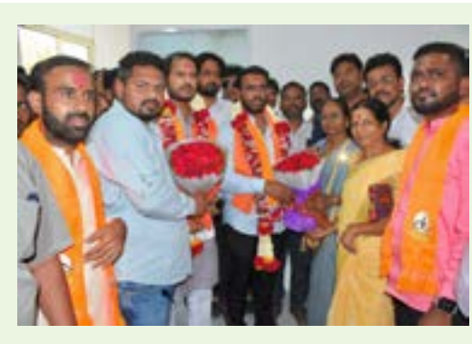
युवासेना आजी-माजी पदाधिकारी-लोकप्रतिनिधी आणि शिवसैनिक यांनी शिवसेना मध्यवर्ती कार्यलयात पुष्पगुच्छ देऊन स्वागत सत्कार केला.