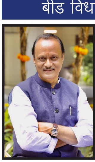
बीड (प्रतिनिधी) दि.१० : बीड विधानसभा मतदारसंघासाठी मला निधी मिळत नाही म्हणून बीडच्या आमदारांचे सतत रडगाणे सुरू