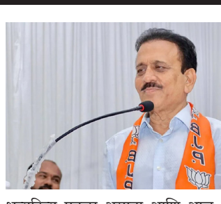
भव्यदिव्य पुतळा असावा आणि आज प्रत्यक्षात आपण बघतोय. राज्यात कुठे नसेल असा राजांचा दरबार याठिकाणी

मंत्री गिरीश महाजन यांच्या जामनेर मतदारसंघात आज महायुतीचा कार्यक्रम पार पडला. यावेळी छत्रपती शिवाजी महाराजांच्या भव्य पुतळ्याचे अनावर झाले. या कार्यक्रमात गिरीश महाजन यांनी भाषण करताना आपण भाजपमध्ये सर्वात सिनियर अल्यांचे वक्तव्य केले. "माझ्या मनामध्ये शब्द होता. कार्यकर्त्यांच्या मनात स्वप्न होतं की, जामनेर शहरामध्ये आमचा जाणता राजा, स्वयंतचा राजा छत्रपती शिवाजी महाराज यांचे स्मारक व्हावं. त्यांचा