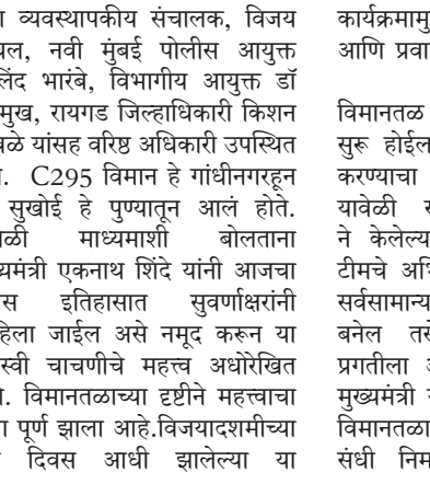
उपमुख्यमंत्री देवेंद्र फडणवीस यांच्या उपस्थितीत नवी मुंबई आंतरराष्ट्रीय विमानतळाच्या धावपट्टीची चाचणी यशस्वीपणे उतरविण्यात आली.