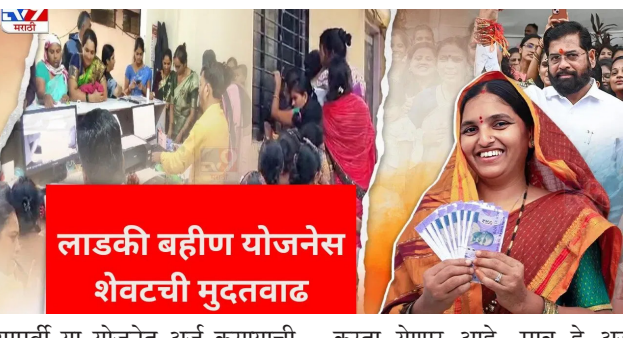
लाडकी बहीण योजनेस शेवटची मुदतवाढ

महायुती सरकारची सर्वात महत्वाकांक्षी योजना असलेल्या "मुख्यमंत्री-माझी लाडकी बहीण" योजनेला पुन्हा एकदा मुदतवाढ देण्यात येणार आहे. या योजनेचा लाभ आतापर्यंत ज्या महिलांना मिळाला नाही, त्यांच्यापर्यंत लाभ पोहचवण्यासाठी ही मुदतवाढ देणेत आली आहे. आता महाराष्ट्रातील महिलांना मुख्यमंत्री-माझी लाडकी बहीण योजनेत अंतर्गत अर्ज करण्यासाठी १५ ऑक्टोबर २०२४ ही नवीन मुदत दिली आहे.