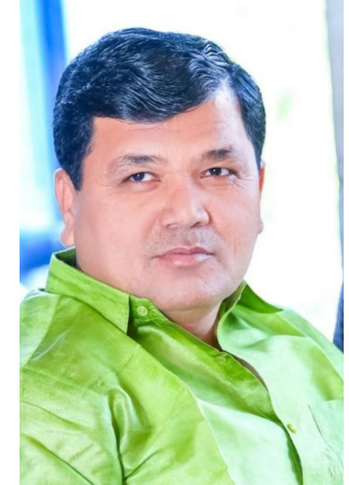
माजलगाव दि. (प्रतिनिधी) राष्ट्रवादी काँग्रेस पार्टीचे सर्वेसर्वा शरदचंद्रजी पवार साहेब हे बीड जिल्ह्यातून विधानसभेसाठी मुस्लिम समाजाचा एक तरी उमेदवार