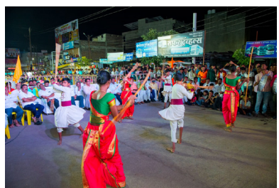
दैनिक लोकआरंभ //

— दांडपट्टा, हलगी पथक व सांस्कृतिक कार्यक्रमाने वेधले लक्ष