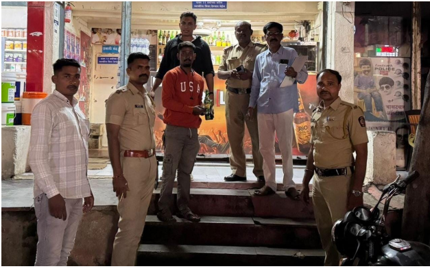
दारू विकली जाते आणि पिल्या जाते त्या ठिकाणी छापे मारले आहेत. दारू पिण्याचे साहित्य आणि त्याची आढळून आलेल्या लोकांना