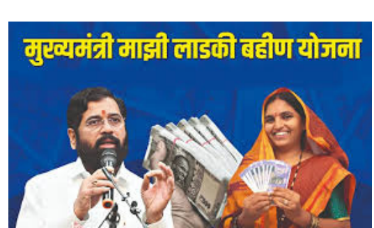
अजित पवार (Ajit Pawar) यांनी परकीत दिली. त्याचप्रमाणे जनसन्मान यात्रेत केली.

योजनेसाठी एक कोटीहून अधिक अर्ज स्वीकारण्यात आले आहेत. तसेच योजनेचे दोन हप्ते महिलांच्या खाल्यात जमा करण्यात आले आहेत. आता ऑक्टोबर, नोव्हेंबरच्या हप्त्याची प्रतीक्षा संपली आहे. जनसन्मान यात्रेत केली घोषणा : समाजातील सर्व समाज घटकांचा सर्वांगीण विकास करण्यासाठी महायुतीचे हे सरकार वचनबद्ध असल्याची ग्वाही उपमुख्यमंत्री