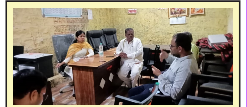
पिठ्ठी गावामध्ये मा जिल्हाधिकारी मंडम यांनी भेट दिली व विविध विकास कामाची पाहणी करून सरपंच यांच्या कामाचे कौतुक केले. तर