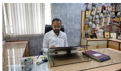
कामांचा लाभ महाविद्यालयाच्या प्रगतीसाठी व्हावा व संस्थेची जबाबदारी उत्तम रीतीने

वाटचाल राहिलेली आहे. वैजनाथ उद्योग समूहाचे चेअरमन म्हणून त्यांनी अनेक फॉर्म यशस्वी चालविल्या आहेत. जिल्हा परिषद सदस्य म्हणूनही त्यांनी उत्तम कार्य केलेले आहे. वाणिज्य विषयांमध्ये डॉक्टरेट पदवी मिळाल्यानंतर त्यांची वाणिज्य व इतर सांस्कृतिक क्षेत्रातील काही पुस्तके प्रकाशित आहेत. राष्ट्रीय व आंतरराष्ट्रीय नियतकालिकामध्ये त्यांचे शोधनिबंध प्रकाशित झालेले आहेत. त्यांच्या प्रशासकीय