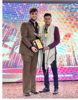
अर्न एंड लर्न परफॉर्मर अवॉर्ड- २०२४ राष्ट्रीय पुरस्काराने सन्मानित करण्यात आले.

अलिकडच्या काळात जाणवते आहे. सोशल मीडिया च्या विविध साइट वर पैसे कमवण्याचे मार्ग असताना भारत सरकार मान्यताप्राप्त नॉलेज वेव इंडिया च्या वतीने वयाच्या २० व्या वर्षी डिजिटल मार्केटिंग पदवी चे शिक्षण घेणारा व महिन्याला लाखों रुपये कमऊन या कमाव व शिका