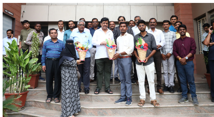
यावर्षी यशवंत महाविद्यालयाच्या रसायनशास्त्र विभागातील ६

आपल्या कर्तृत्वाचा ठसा उमटवत आहेत. आजपर्यंत या विभागातून २५० पेक्षा अधिक विद्यार्थ्यांनी सेट, नेट, गेट तसेच अनेक स्पर्धात्मक परीक्षांमध्ये घवघवीत यश संपादन केलेले आहे. तसेच या विभागात आत्तापर्यंत दीडशे पेक्षा जास्त विद्यार्थ्यांनी शिक्षण क्षेत्रातील सर्वोच्च अशी ( पीएच.डी.) ही पदवी सुद्धा प्राप्त केलेली आहे. याही वर्षी रसायनशास्त्राची ही यशस्वी परंपरा कायम राहिली असून