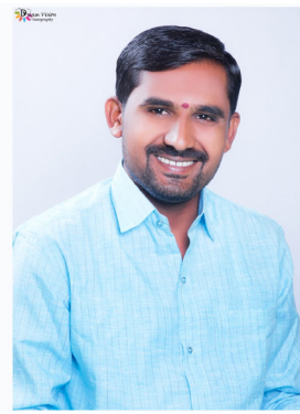
अशीच भूमिका विधानसभेपर्यंत राहिली तर ओबीसी समाज वंचित समाज राज्य सरकारला घरी

की आम्ही ओबीसी समाजाच्या आरक्षणाला कसलाही धक्का न लागता मराठा समाजाला आरक्षण देणार आहोत. राज्य सरकार स्वतःची राजकीय पोळी भाजण्यासाठी दोन समाजामध्ये गेली एक वर्षापासून आरक्षणाच्या नावावर जो महाराष्ट्रामध्ये व जास्ती करून मराठावाड्यामध्ये जो वाद चालू आहे त्या वादाला एका समाजाला पाठवळ देऊन दुसऱ्या समाजाला विरोधामध्ये जाण्यासाठी हे सरकार भाग पाडत आहे. जर या सरकारची