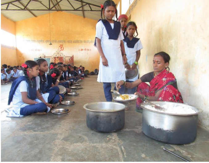
तांदळाची खीर, चणा पुलाव, नाचणीचे

बीड (प्रतिनिधी) प्रधानमंत्री पोषणशक्ती निर्माण योजनेतर्गत शैक्षणिक वर्ष २०२४-२५ पासून पोषण आहारामध्ये विद्यार्थ्यांना दिल्या जाणाऱ्या १५ पाककृती निश्चित करण्यात आल्या असून ३ संरचित आहार पद्धती नुसार व्हेजिटेबल पुलाव, नाचणी सत्त, अंडा पुलाव, तांदळाची खिचडी अशा पदार्थांचा समावेश करण्यात आला आहे. त्यामुळे विद्यार्थ्यांची खिचडीपासून सुटका होणार असून निश्चित केलेल्या पाककृती मध्ये व्हेजिटेबल पुलाव, अंडा पुलाव, मसाले भात, मोड आलेली मटकीची उसळ, मटार पुलाव, गोड खिचडी, मुगडाळ, खिचडी, चवळी खिचडी, मुग, शेवगा, वरण भात,