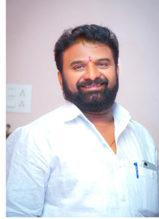
जिल्हा बीड येथील 8.वाजता व