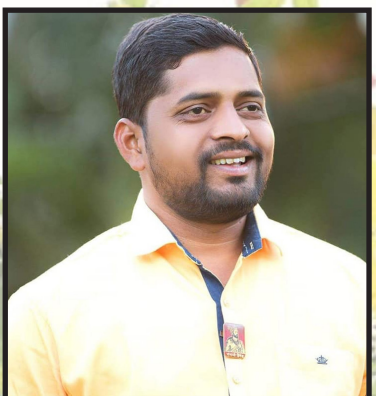
संपादक: राहुल मारोतीराव वाईकर