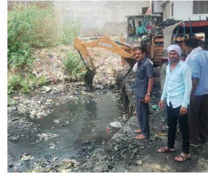
काढण्यात येणार असून नागरिकांनी आपला कचरा घंटागाडी मध्ये टाकावा असे आवाहन स्वच्छता विभागाच्या वतीने करण्यात आले

कोणतीही गैरसोय होणार नाही याची खबरदारी घेणार असल्याचे मुख्याधिकारी यांनी सांगितले. परळी शहरातील सरस्वती नदी गोपाळ टॉकीज ते सार्वजनिक समशान भूमी, उखळवेस ते सिमेंट फेक्ट्री, मलिकपुरा, पंचायत समिती ते नाथ रोड, आझाद नगर (वीटभटी पूल) ते रेल्वे लाईन पुल तसेच विविध भागातील नाल्या यासह शहरातील विविध छोट्या मोठ्या नाल्यांमधील गाळ व कचरा काढण्यात येत आहे. यासाठी दोन जेसीबी, पाच ट्रॅक्टरद्वारे व कर्मचाऱ्यांच्यासहाने साफसफाई करण्यात येत आहे. पावसाळा सुरू होई पर्यंत ही साफसफाई करण्यात येणार असून या काळात शहरातील ज्या नाल्या तुंबल्या आहेत. त्यातील गाळ